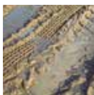
ГРУНТ И ГРЯЗЬ